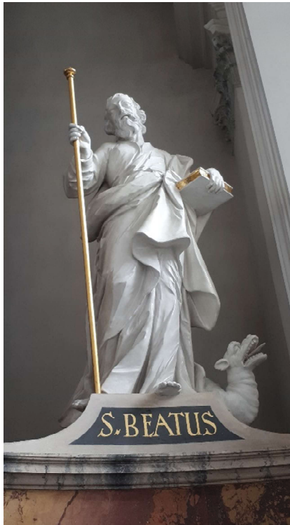
Hl. Beatus, Pfarrkirche Sarmenstorf